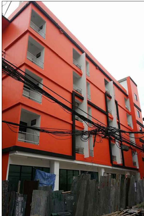
งานทาสีภายนอก