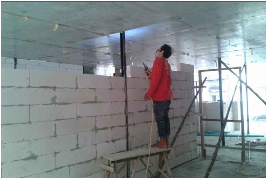
งานก่ออิฐมวลเบา