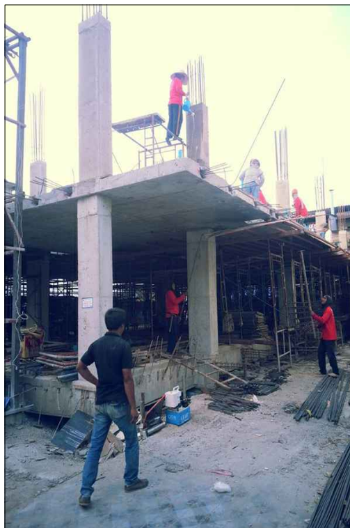
ระบบพื้น POST-TENSION ชั้นที่ 2