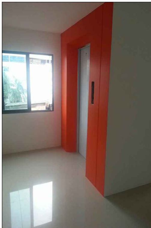
บริเวณทางเดินและ โถงลิฟท์