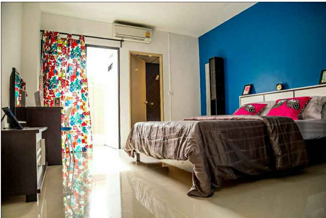
บรรยากาศภายในห้องพัก