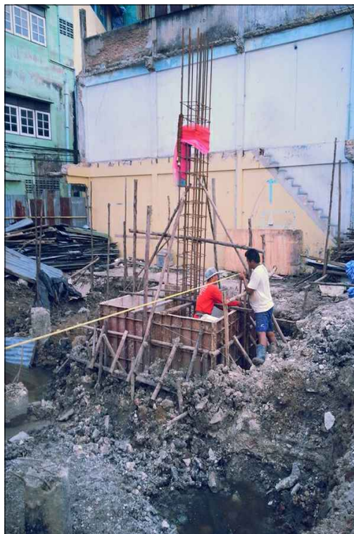
งานขุดหลุมและ โครงสร้างฐานราก