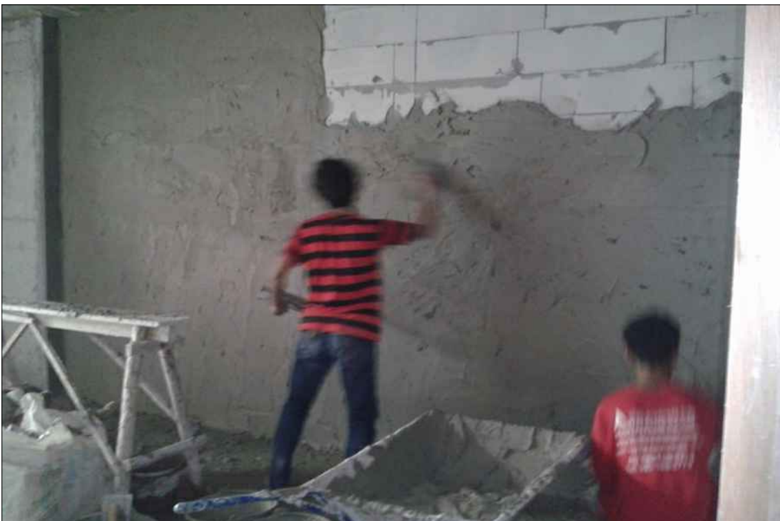
งานฉาบปูนภายนอกและ ภายใน