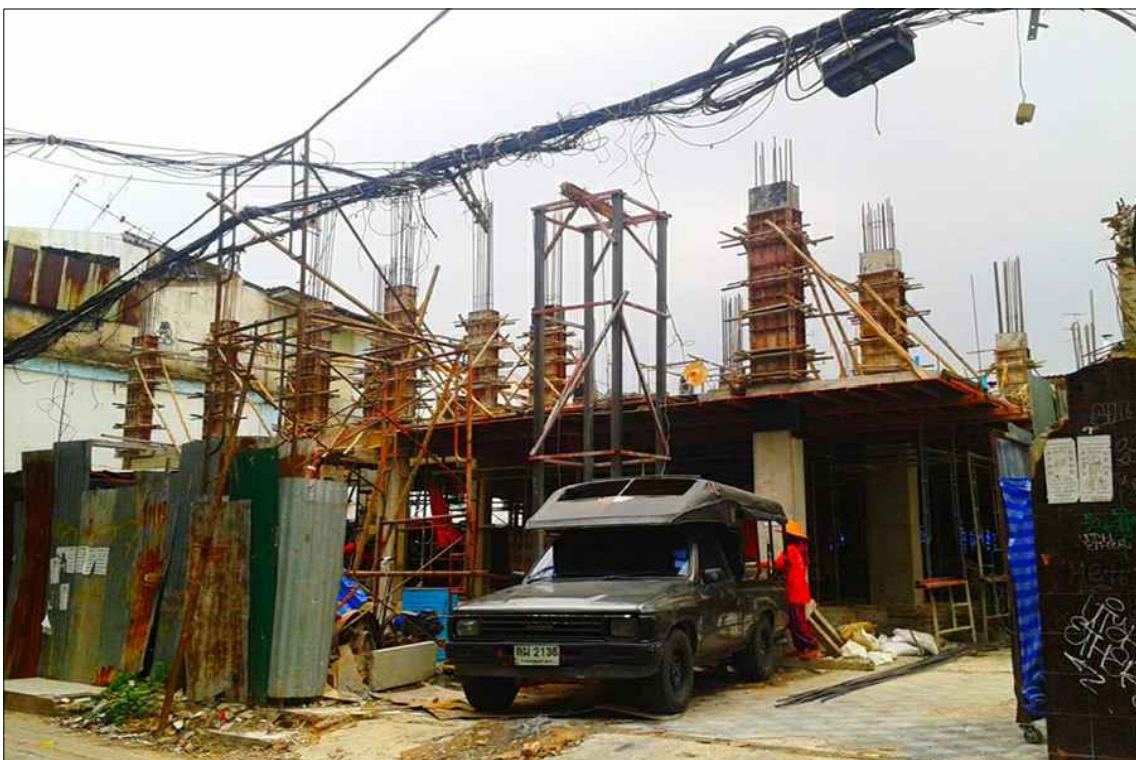
โครงสร้างลิฟท์และ ระบบพื้น POST-TENSION ชั้นที่ 2