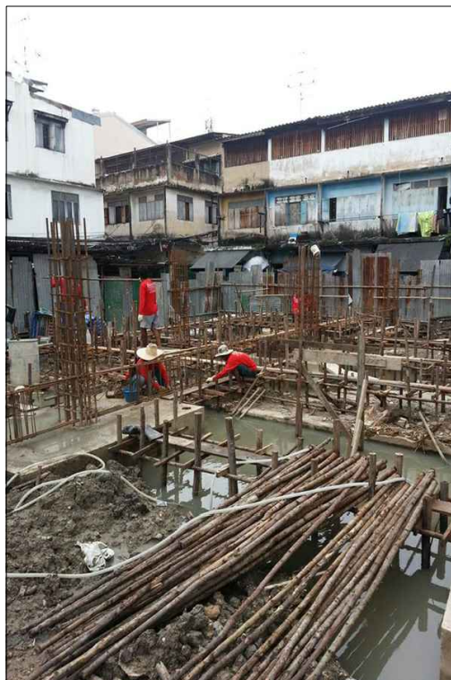
งานแกะแบบฐานรากและ เตรียมโครงสร้างคานคอดิน