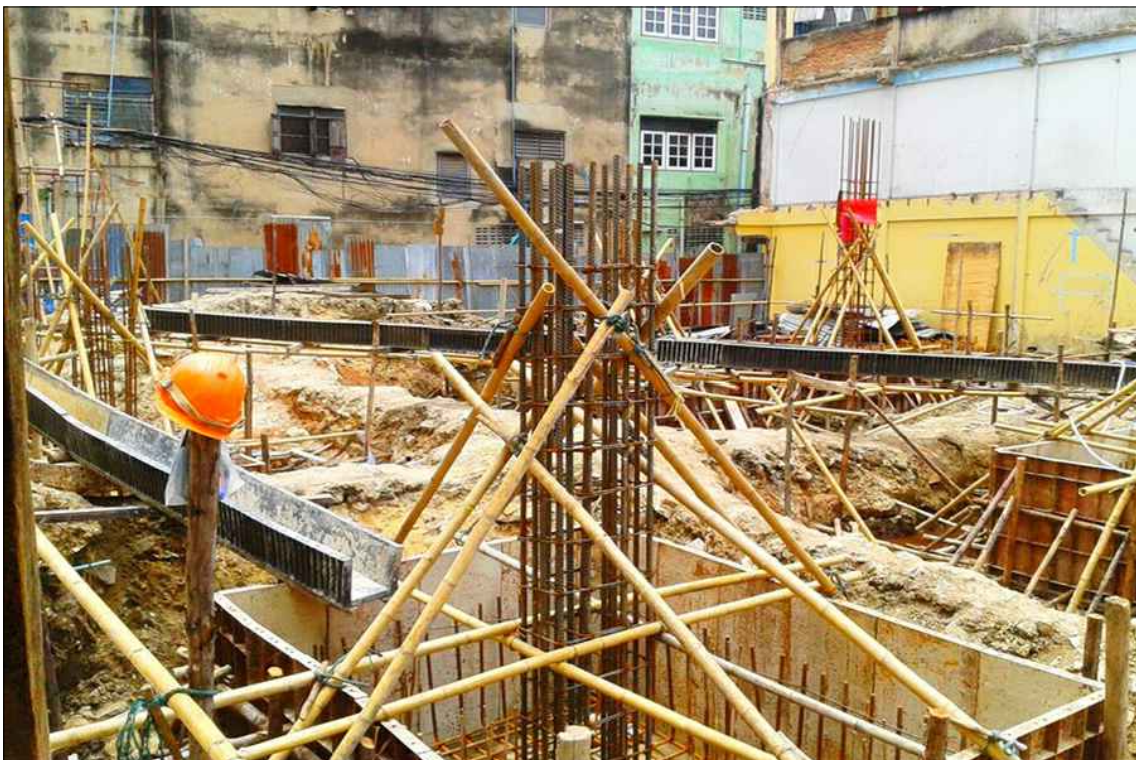
งานตัดหัวเสาเข็มและ เทคอนกรีตฐานราก