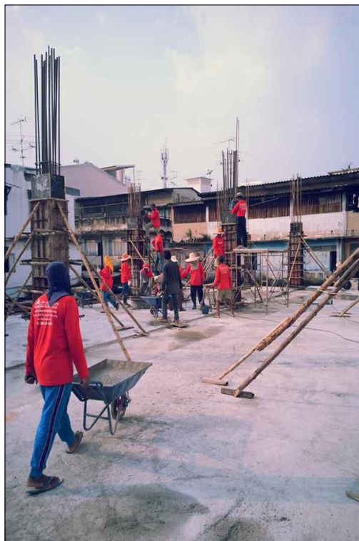
งานโครงสร้างพื้นชั้นที่ 1