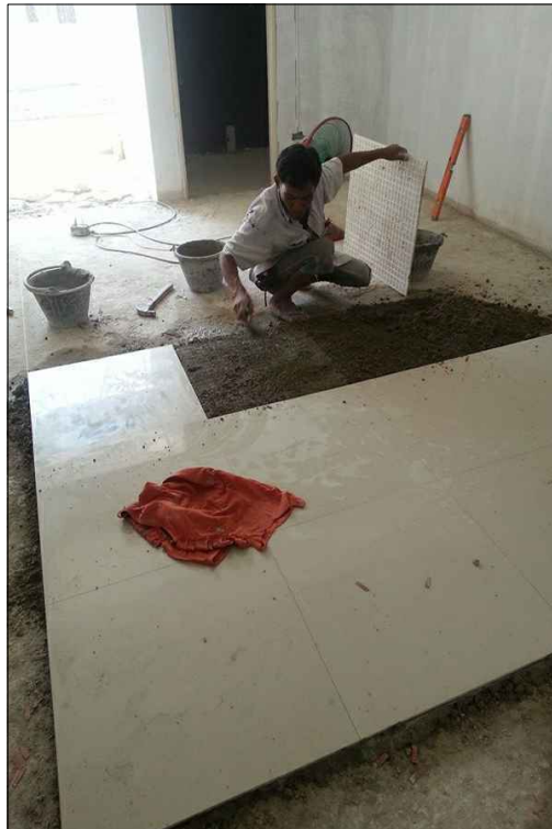
งานปูกระเบื้องพื้นและ ผนัง