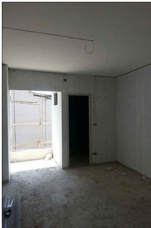
งานระบบสุขาภิบาลและ ระบบไฟฟ้า